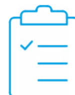
Certificado de calibración con acreditación