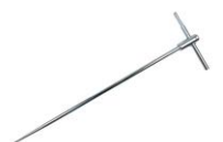
Sonda de medición para clavar en el suelo (80 cm)