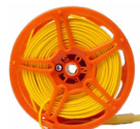
Cable 50 m ama- rillo para medir la toma de tierra en carrete (conec- tores tipo banana)