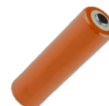
4 x pila alcalina 1,5 V AA, LR6