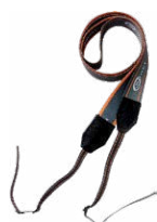
Arnés para el medidor (tipo M1)