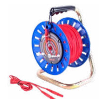
Cable 100 m rojo para medir la toma de tierra en carrete