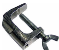
Mordaza (conec- tor tipo banana)