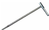
Sonda de medición para clavar en el suelo (30 cm)